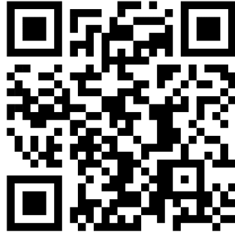
แบบ 56-1 One Report ประจำปี 2567

ซึ่งประกอบด้วย งบการเงินประจำปี 2566 และข้อมูลบริษัทโดยสรุปประจำปี 2566